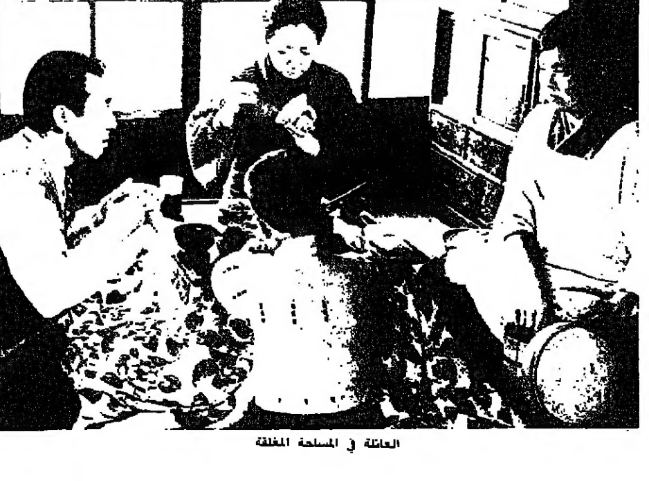
العائلة في الساحة المغلقة

قوة إيمامورا، والكبرى، وحاسمه أيضاً، السينمائي جدا، هو اللانفاه لآفاه جسد المرأة الضعيفة كليل، لا تتأوه دوة الحرير، رمز علامة الجوع لكن الشهوة أيضاً، والطبيعة غير النقية (الدورة) التي تعطي ذلك القماش النقي (الحرير)... ● شبيوة قلته، هو السينما التي تنقصنا اليوم بوجهها الخشن، غير الزايف الصادق، في نقشة بالزمن الحاضر نقش عنيف كاش إنساني وسخر في جدار الزمن السميد، البلا روح